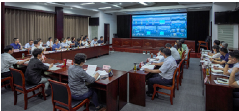
区领导调研城市大脑建设 (区数据资源管理局 供稿)

务流程再造,推进信息互认共享、办事材料复用等数据归集,在为市民日常服务、行政审批等方面走在全国前列。 (李楠)