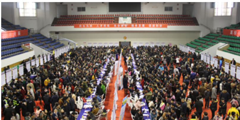
2019年2月18日，富阳区春季大型人力资源交流大会暨高校毕业生就业洽谈会在区体育馆举行

【主要洪涝灾害】 2019年6月17—21日，富阳区平均面雨量163.20毫米。19日14时30分杭州市富阳区人民政府防汛抗旱指挥部（简称区防）启动四级应急响应，22日10时取消IV级应急响应。全区直接经济损失800多万元。7月12日8时至13日19时，富阳区平均面雨量142.00毫米，7月13日平均面雨量135.90毫米，为有气象记录以来第13位，达到五年一遇强降雨标准。是日7时30分区防指启动IV级应急响应，是日13时15分启动III级应急响应。14日16时取消III级应急响应。全区受灾乡（镇、街道）21个，受损溪堤5.77千米，损坏农村道路5.80千米，受淹农田2933.34公顷，小面积塌方146处，新登柴家山塘库区右侧较大山体滑坡，老旧房损