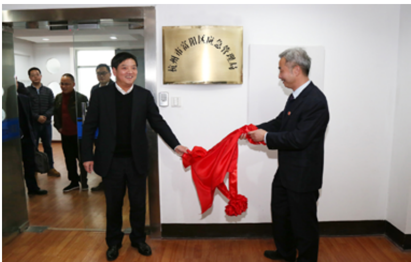
2019年1月20日，杭州市富阳区应急管理局揭牌

【安全生产执法】 2019年，区应急管理局确定1097个执法日（按个人计算的，如两个人同时执法一天，就是两个执法日）的工作目标，全员执法、委托执法，全年立案非事故处罚案件187件，罚款261.09万元。