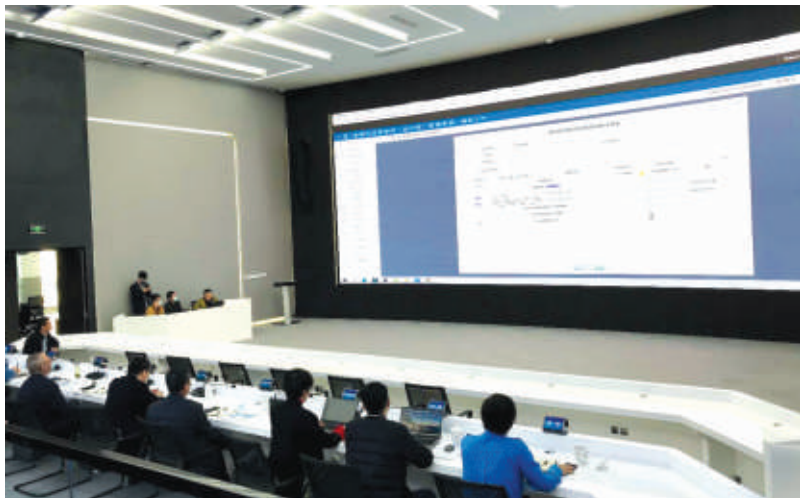
2021年11月12日，富阳区数字化改革应用场景演示