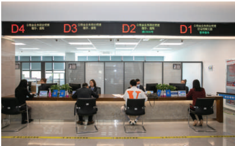
富阳区公积金办理窗口