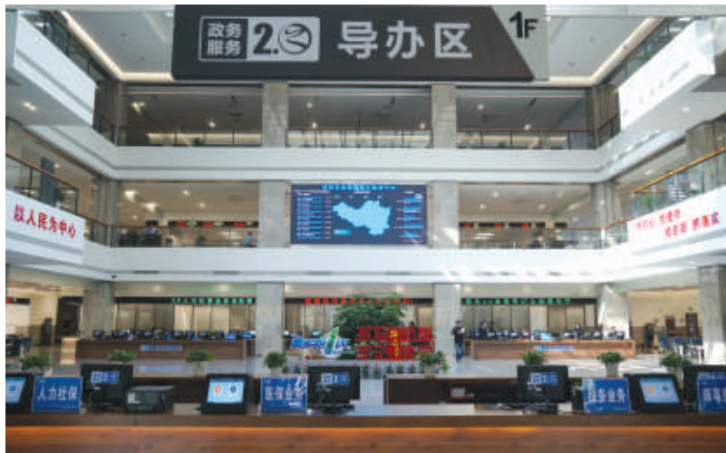
富阳区行政服务中心