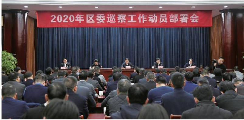
2020年1月10日，2020年区委巡察工作动员部署会召开