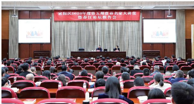
2020年11月9日，富阳区2020年度第五期富春名家大讲堂暨春江论坛报告会举行