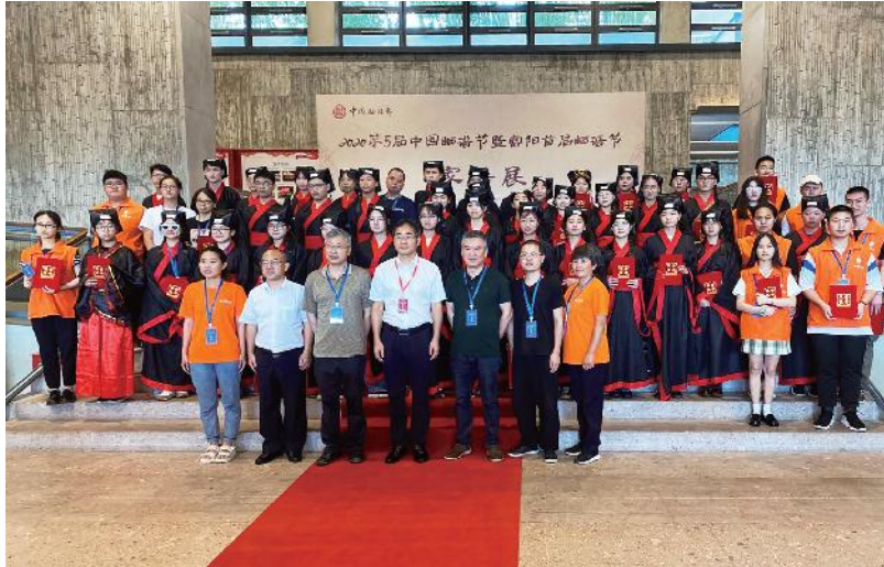
2020年7月26日，“2020第五届中国晒谱节暨富阳首届晒谱节”在富阳区富春山馆举行