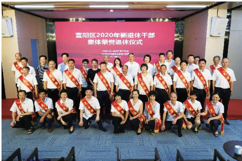
2020年8月12日，全区2020年新退休干部集体荣誉退休仪式暨进一步深化“争做最美老干部，人人增添正能量”活动举行