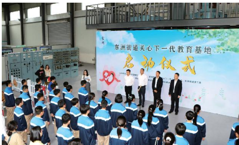
2020年9月23日，“东洲街道关心下一代教育基地启动仪式”举行