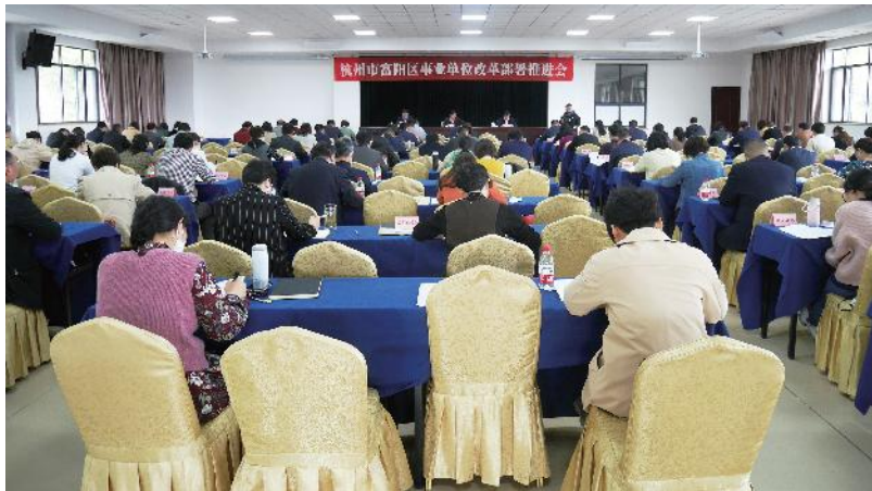
2020年4月15日，富阳召开事业单位改革部署推进会