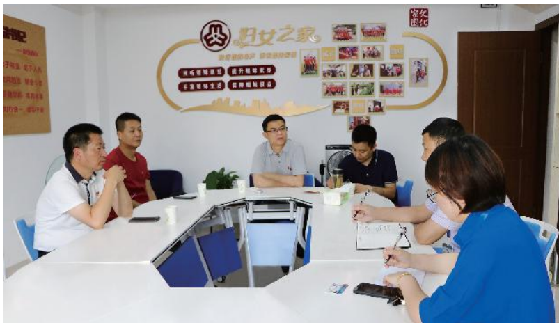
2020年6月，区信访局赴金苑社区对接协调“百日解百难”事项